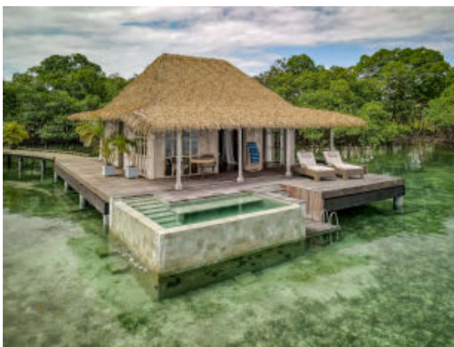
LAS VILLAS, SUPISCINA Y EL DESCANSO. Sin duda, una experiencia sublime.