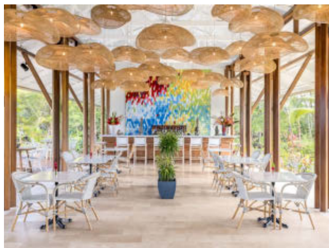
CORAL CAFÉ. La cafetería del hotel, de diseño impoluto.

Para los viajeros frecuentes y quienes gustan de experimentar con nuevos sabores, los menús cuentan con ofertas de temporada inspiradas en cocinas de todo el mundo con un toque panameño.