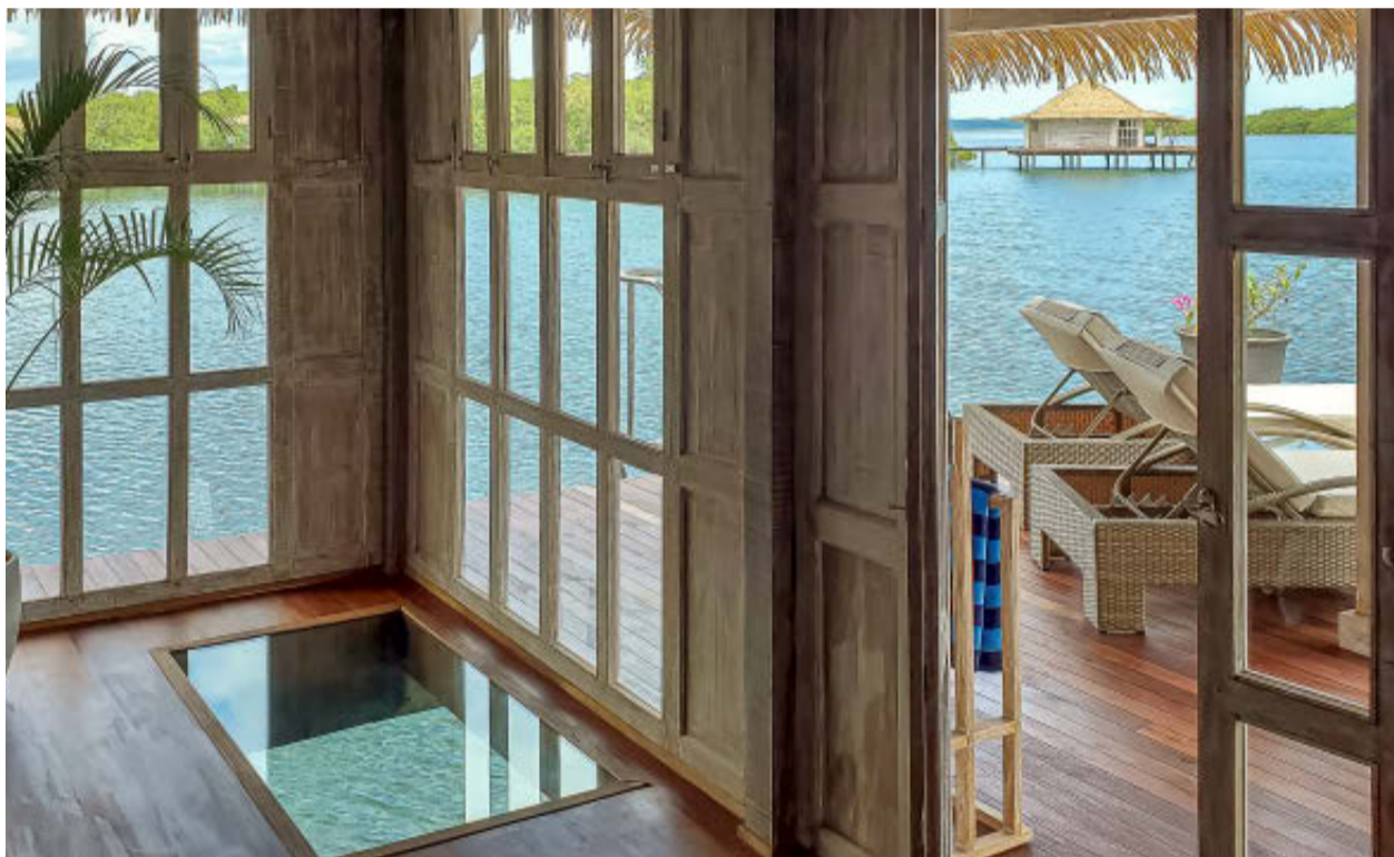
EL INTERIOR DE LAS ESTANCIAS. Ofrece vistas luminosas sin comprometer la privacidad.

Toma como base de llegada la ciudad de Panamá, conectada con 82 vuelos directos desde 37 países. Ahora, trasládete al Aeropuerto Internacional Tocumen, un vuelo regional de una hora y un corto viaje en bote de 15 minutos desde el histórico pueblo de Bocas transportan a los huéspedes a esta escapada de lujo de ensueño.