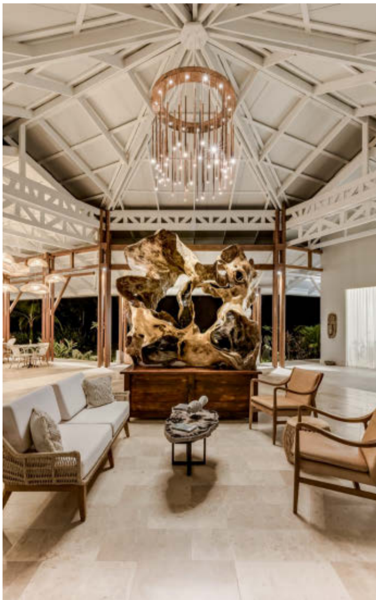
COLONNADE. La primera impresión que ofrece el recinto enamora.

durante la estadía de los huéspedes. Hablando de experiencias acuáticas, Bocas Bali ofrece una variedad de actividades para los huéspedes, que incluyen paddleboarding, kayak, snorkeling y observación de delfines.